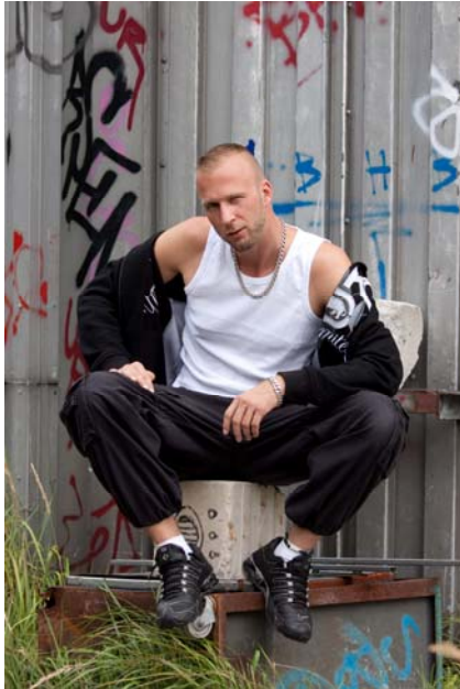
Produzent: Ali Lyck